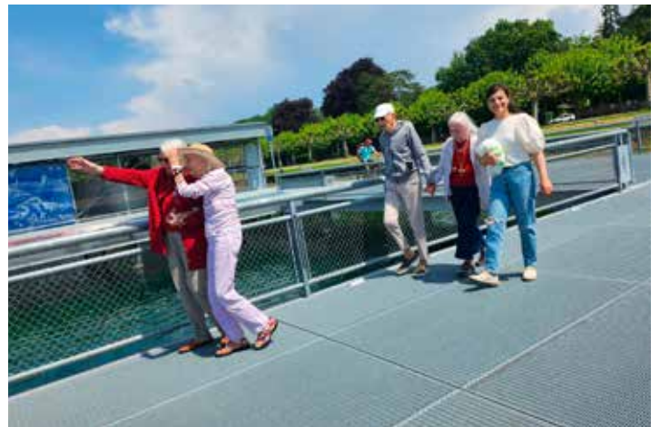
Sortie commune avec la Villa Mona au restaurant de la plage des Eaux-Vives.

Les principales dates du calendrier des évènements de la Maison de la Tour sont présentés en dernière page de ce journal (4e de couverture).