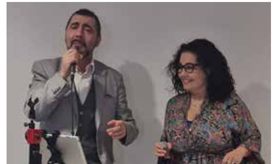
Duo «Alida et Terige».

La période pascalle a été l'occasion de différents évènements, au sein de la Maison de la Tour, marqués par une dimension transgénérationnelle, avec une chasse aux œufs, une journée en famille et un concours de l'œuf.