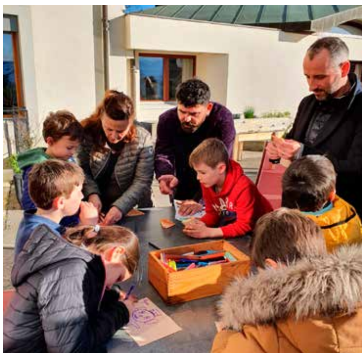
Préparation des vœux à accrocher au bonhomme.

Bonhomme réalisé par le service socio-culturel de la MdIT.